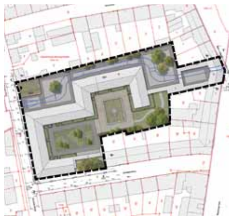
Inmitten von grünen Inseln sollen ca. hundert Wohnung entstehen