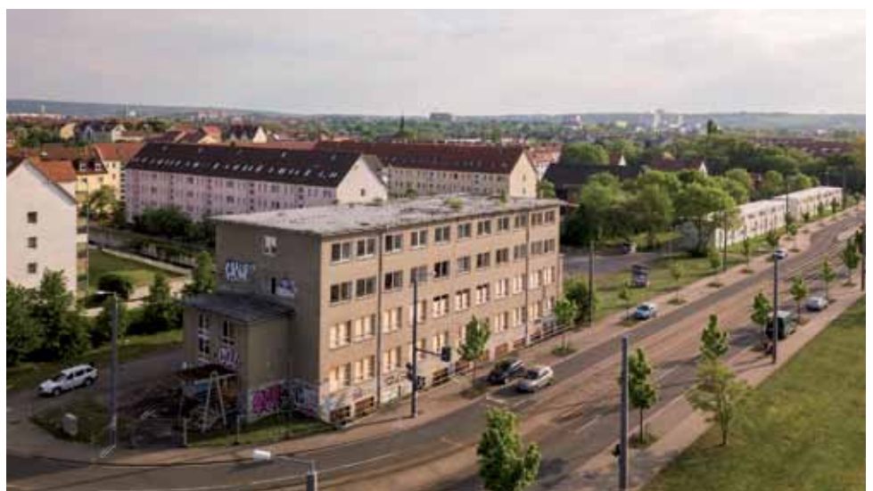
Das Pilotprojekt „WIR LABOR“ von Plattform e.V. ist das einzige Erfurter IBA-Projekt