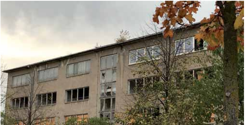
Bis 2023 soll die „Vollbracht 12“ schrittweise nutzbar gemacht werden