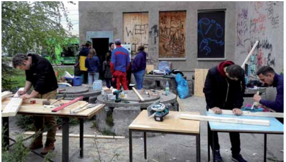
Die künftigen Nutzer sollen selbst mit planen und bauen